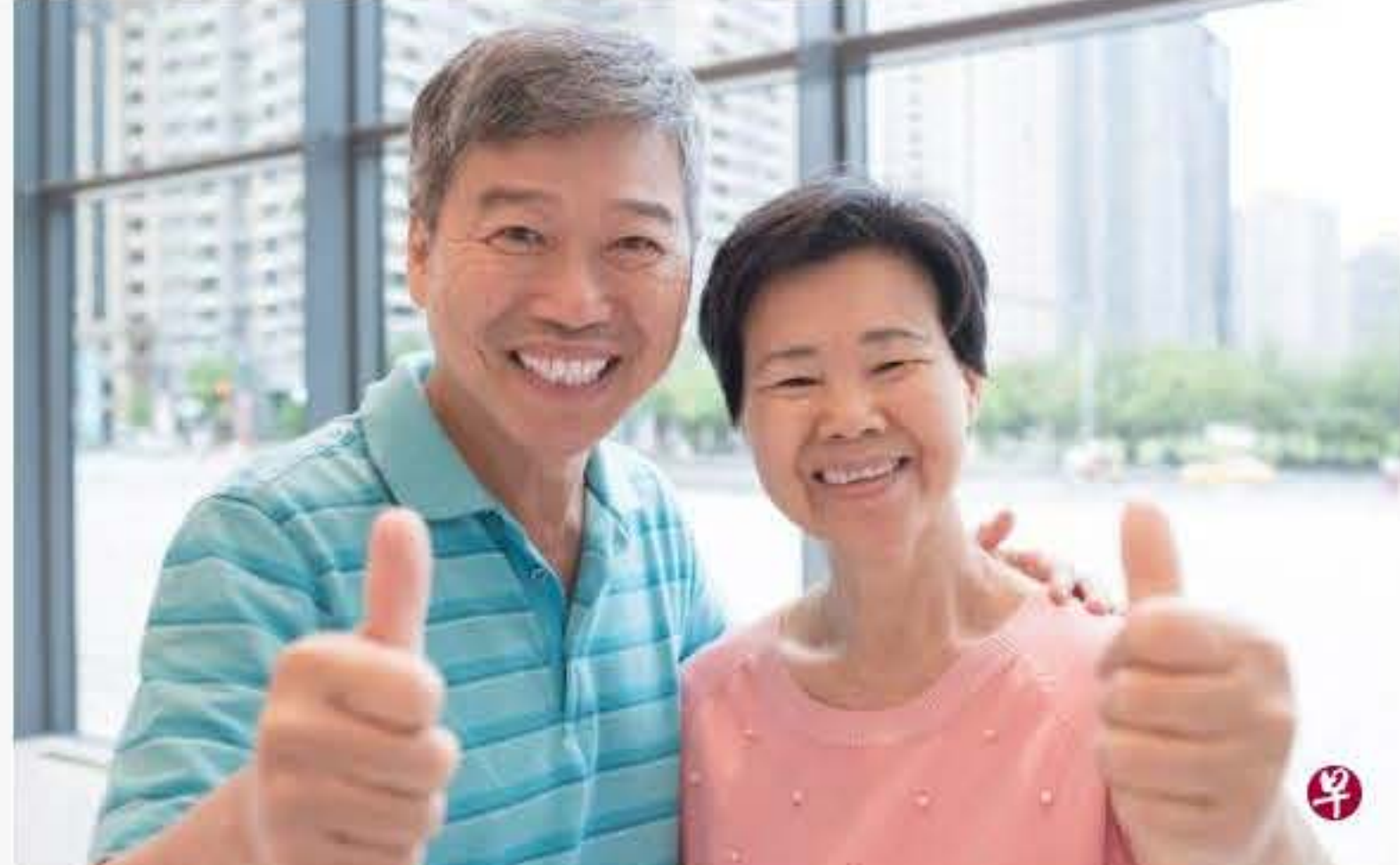
事先做出妥善安排至关重要，年长者就能更加安心，没有后顾之忧。