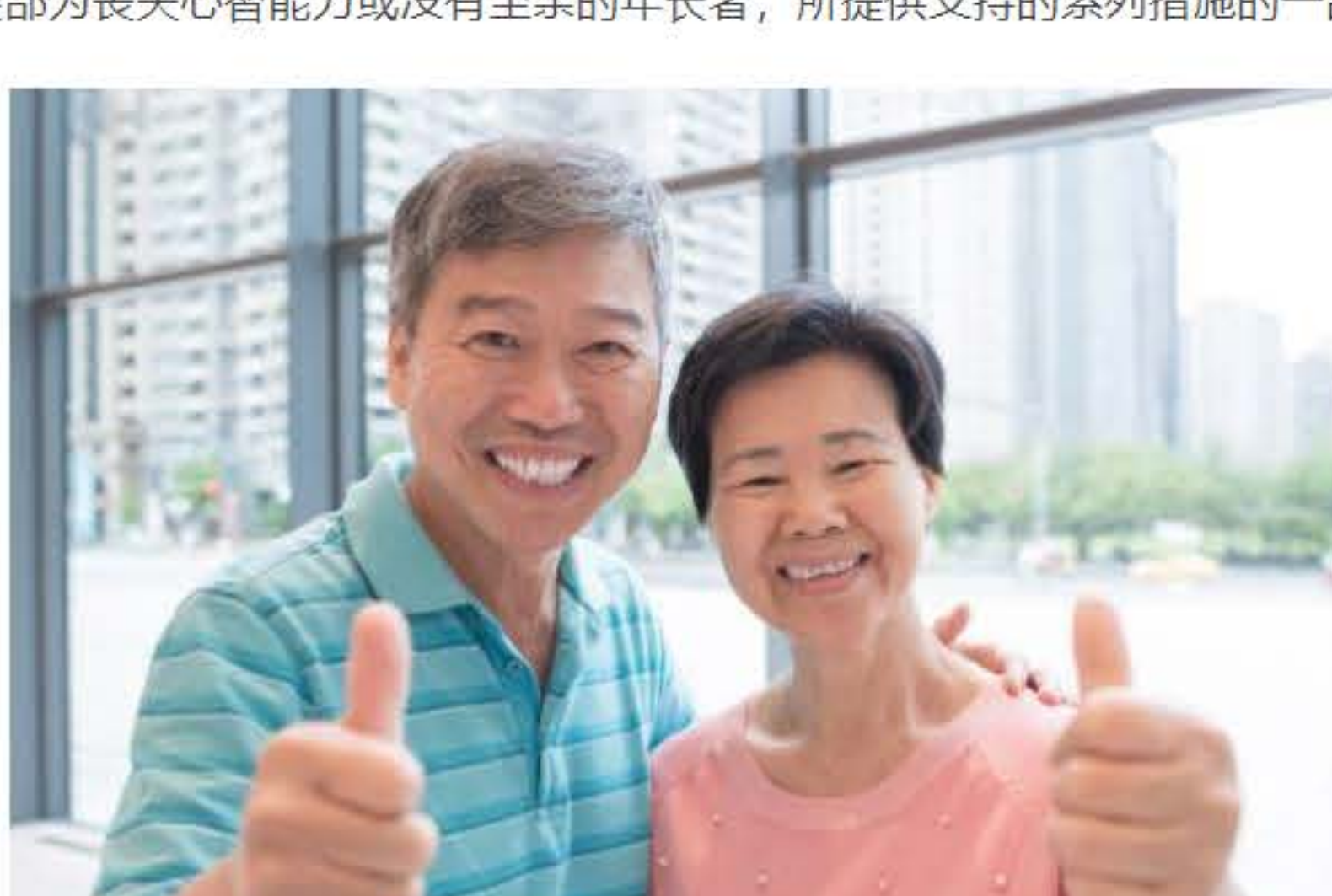
事先做出妥善安排至关重要，年长者就能更加安心，没有后顾之忧。

没有至亲的年长者，可以通过相辅相成的专业代理人和专业被授权人 (Professional Deputies and Donees, 简称PDD) 计划，及早未雨绸缪，以及申请持久授权书 (Lasting Power of Attorney, 简称 LPA)。还有社群亲人服务 (Community Kin Service, 简称CKS)，能让志愿福利团体帮助没有至亲的年长者管理财务。这些计划都是社会及家庭发展部为丧失心智能力或没有至亲的年长者，所提供支持的系列措施的一部分。